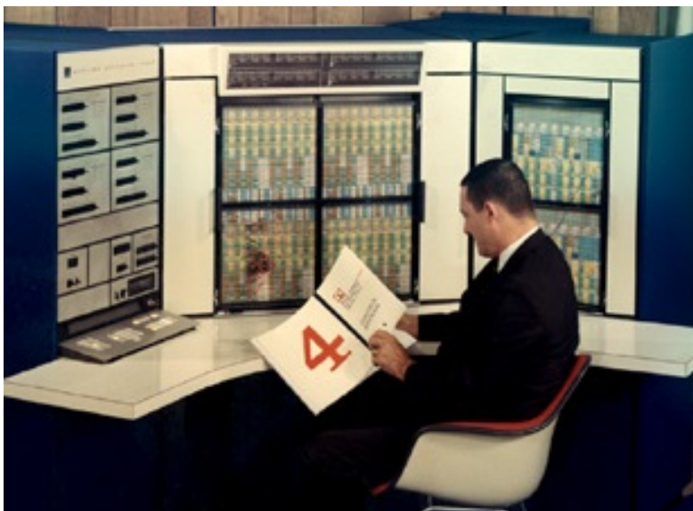
Figuur 1. Analoge computer van Applied Dynamics.

In deze periode wordt nog veel met analoge technieken gewerkt. Er bestonden al analoge computers van de firma Applied Dynamics (figuur 1), waarbij met stekerborden de programmering tot stand gebracht werd. Deze machines werden vooral gebruikt om wiskundige berekeningen uit te voeren. De stekerborden werden later vervangen door logische poorten, zodat de analoge computer digitaal werd bedraad. De analoge computers zijn een stille dood gestorven.