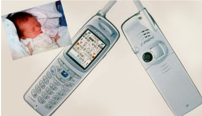
Figuur 3. Mobiele telefoons met camera.

De ontwikkeling van telefonie en computers hebben elkaar versterkt. Van de mechanische telefooncentrales (in 1965) naar volledige digitale elektronische switches (in 2005). Hierbij zijn de digitale theorieën en technieken van belang die in de 50'er jaren ontwikkeld. De ontdekking van de laser speelt een belangrijke rol in de ontwikkeling van de glasvezel als transportmedium waarin licht als communicatiemiddel wordt toegepast. De wederzijdse beïnvloeding van techniek en wetenschap zorgt hier voor een versnelling van de ontwikkeling van de communicatietechnologie.