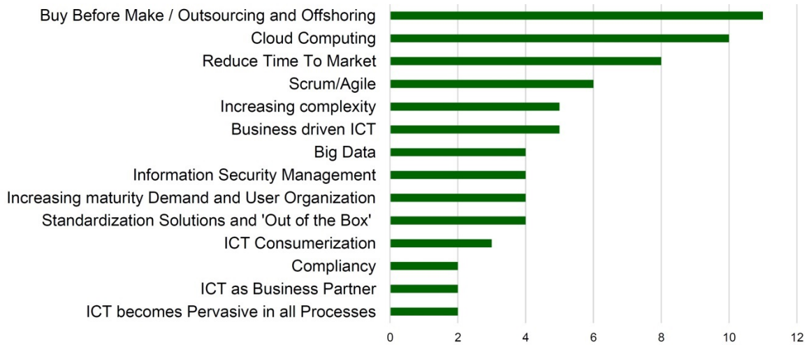
Figuur 1. ICT Trends (onderzoek CIO-platform 2013).

Naast de trends zijn 33 competenties van ICT-professionals in managementrollen verzameld. De onderscheiden managementrollen zijn: Strategy; Architecture; Vendor Management; Contract Management; Service Management; Project Management; Financial Management; Procurement. Van de genoemde competenties zijn er 13 niet in de overzichten opgenomen. Die betreffen bijvoorbeeld managementrollen voor 'Buy before Make' of 'Cloud' en deze vragen specifieke competenties. De resterende 20 belangrijkste competenties die 78% omvatten van de repons zijn: Integrity; Group-oriented leadership; Initiative; Listening and sensitivity; Persuasion; Oral expression and presentation; Decisiveness; Problem analysis and judgement; Skills/Market orientation; Entrepreneurship; Organization sensitivity; Relationship networks; Planning and organizing; Courage and self-confidence; Vision; Customer focus; Flexibility; Collaborate; Adaptability; Creativity.