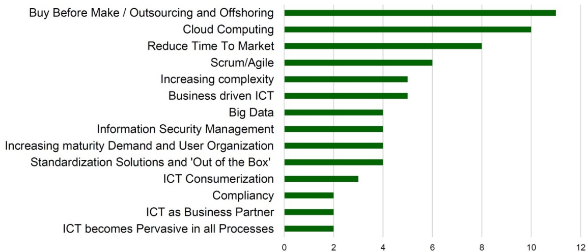
Figuur 1. ICT Trends (onderzoek CIO-platform 2013).

Naast de trends zijn 33 competenties van ICT-professionals in managementrollen verzameld. De onderscheiden managementrollen zijn: Strategy; Architecture; Vendor Management; Contract Management; Service Management; Project Management; Financial Management; Procurement. Van de genoemde competenties zijn er 13 niet in de overzichten opgenomen. Die betreffen bijvoorbeeld managementrollen voor 'Buy before Make' of 'Cloud' en deze vragen specifieke competenties. De resterende 20 belangrijkste competenties die 78% omvatten van de repons zijn: Integrity; Group-oriented leadership; Initiative; Listening and sensitivity; Persuasion; Oral expression and presentation; Decisiveness; Problem analysis and judgement; Skills/Market orientation; Entrepreneurship; Organization sensitivity; Relationship networks; Planning and organizing; Courage and self-confidence; Vision; Customer focus; Flexibility; Collaborate; Adaptability; Creativity.