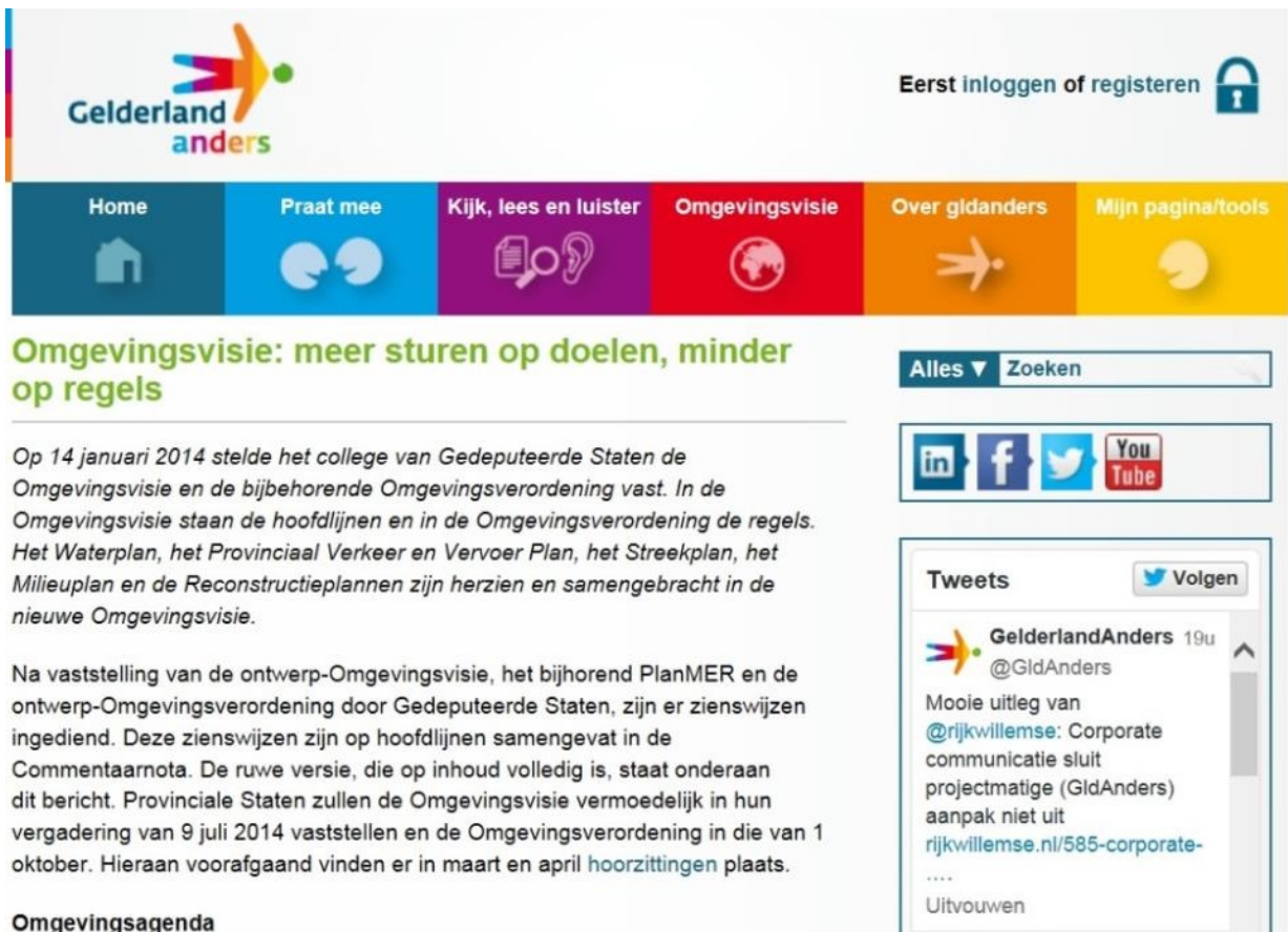
Figuur 4. Website GelderlandAnders.