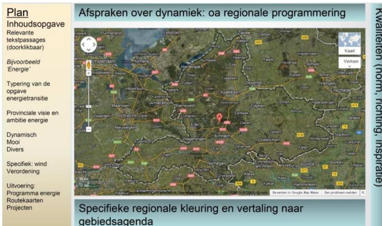
Figuur 3. Overzicht thema's in 'communicatie met community'.