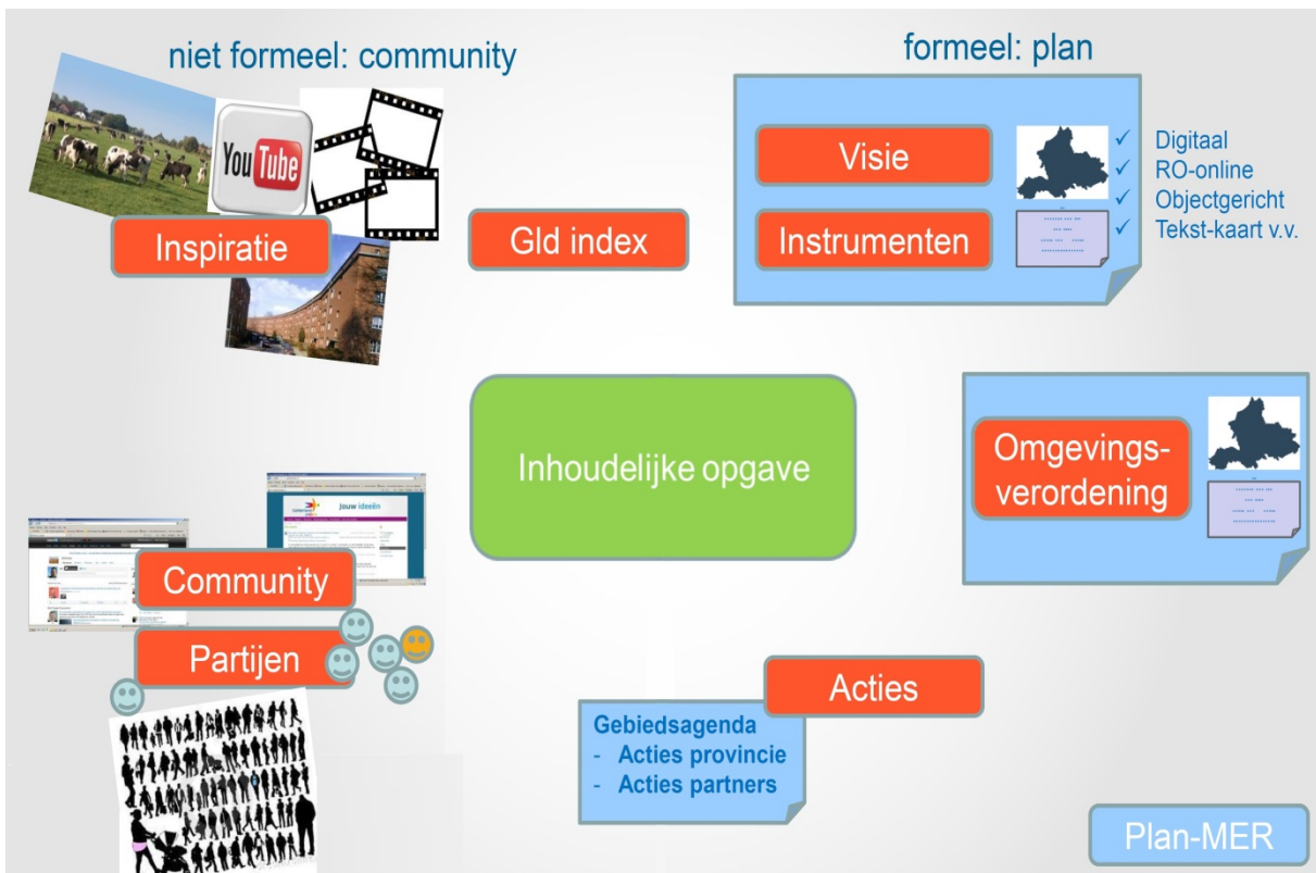
Figuur 5. Overzicht rondom inhoudelijke opgave ontwikkeling omgevingsvisie.