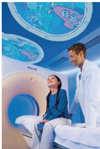
Ziekenhuisruimte die patiënt geruststelt

Om ambient intelligence te realiseren is het nodig dat de omgeving kan reageren of kan interacteren met de mens. De ruimte moet zich dynamisch kunnen aanpassen, zodat de mens dit als natuurlijk en intuïtief begrijpelijk ervaart. Denk aan tal van omgevingsfactoren die zich hiertoe lenen zoals verlichting, die in felheid en kleur kan variëren en aan textiel of ander materiaal dat in kleur, stijfheid en textuur kan veranderen.