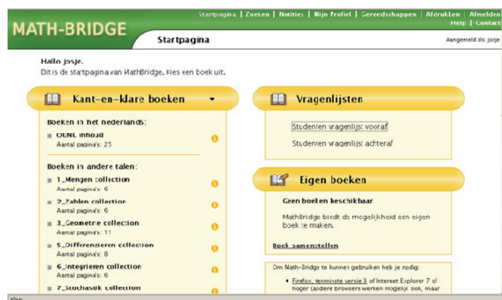
FIGUUR 1 De startpagina van Math-Bridge

Internationaal kampen universiteiten en studenten met aansluitproblematiek op het gebied van wiskunde [1]. Math-Bridge is een internationaal project gericht op het aanpakken van deze problematiek [2]. Doel van het project is het digitaal beschikbaar stellen van remediërend wiskundemateriaal in verschillende talen, voor eerstejaars studenten van verschillende opleidingen. Bestaand materiaal uit verschillende landen is daarvoor vertaald en bewerkt. De bewerking houdt onder meer in dat al het materiaal is opgesplitst in leerobjecten die voorzien zijn van metadata, waarin inhoud, niveau en competenties zijn beschreven. Met behulp van deze metadatering wordt een student-model bijgehouden, en is het mogelijk om voor een individuele student, of voor groepen studenten met een gezamenlijke achtergrond, speciaal materiaal bijeen te zoeken. In het project wordt samengewerkt door 10 universiteiten uit 7 verschillende landen. 2 Het materiaal is beschikbaar in 7 talen (Engels, Duits, Frans, Spaans, Nederlands, Fins en Hongaars). Het onderwijsmateriaal bestaat uit tekst, illustratieve applets, animaties en interactieve opgaven. Met behulp van een ingebouwde functieplotter kan een student eenvoudig een grafiek tekenen. Het materiaal wordt aangeboden via ActiveMath, een geavanceerde digitale omgeving die het leren van wiskunde ondersteunt.